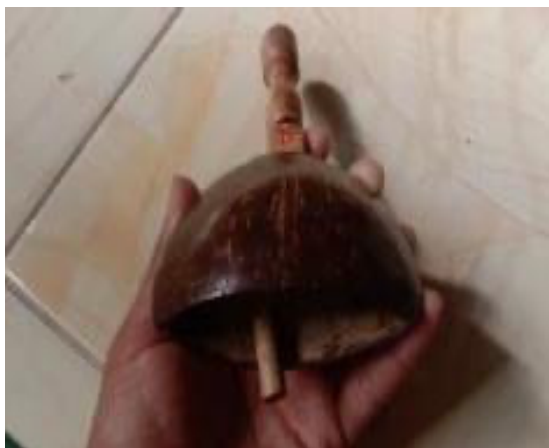
Bentuk Alat Musik Kolotik